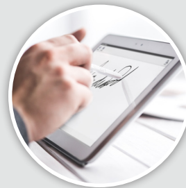
Confirmación del pedido con la firma del cliente

Permite llevar a cabo todas las funciones desde una tablet (rutas, cobros pendientes, consulta de stocks, facturación...) con tecnología 4G, y es operativo sin necesidad de conexión de datos. Reduce el tiempo de espera entre pedido y servicio.