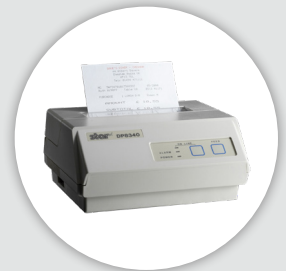
Impresión sin cables via Bluetooth